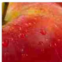
Agricoltura: Oranfrizer "Bene"