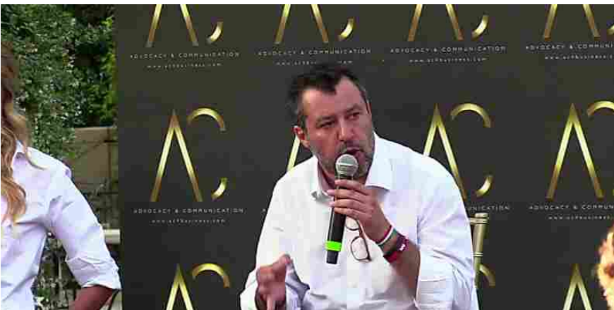
Salvini insulta Zingaretti: 'Un cretino. Imbarazzante sui fatti di Mondragone'