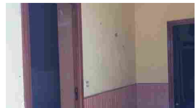
Appartamenti Vittoria via Duca D'Aosta - 54000