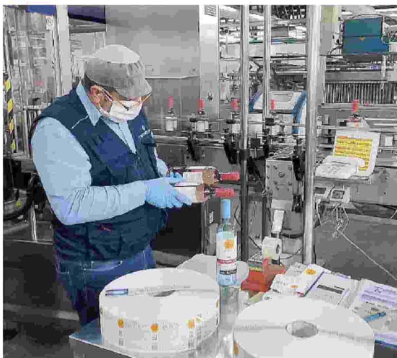
Eccellenza. Organizzazione in distretti per rilanciare le imprese siciliane