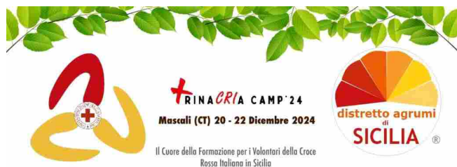
Locandina TrinaCRla Camp 2024